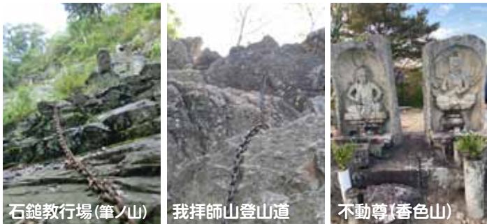
石鎚教行場(筆ノ山)

五岳山には善通寺と空海の霊跡を結ぶ修験の道があります。平安時代の山岳寺院跡もあり、修験の香を体感できる人気のスポットになっています。毎年春に、善通寺市主催の空海ウォークが開催されます。