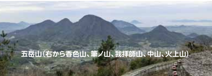
五岳山(右から香色山、筆ノ山、我拝師山、中山、火上山)