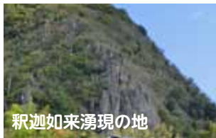
釈迦如来湧現の地

空海の行道所(修行の場)だった禅定があります。捨身ヶ岳の上には、修行中の空海に釈迦如来が現れた釈迦湧現の地があります。