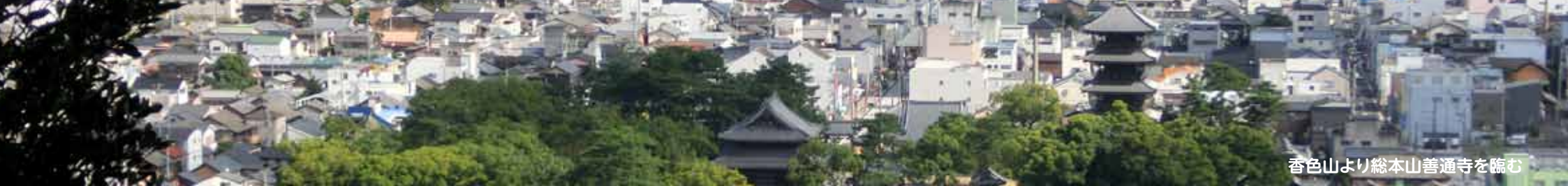
香色山より総本山善通寺を臨む