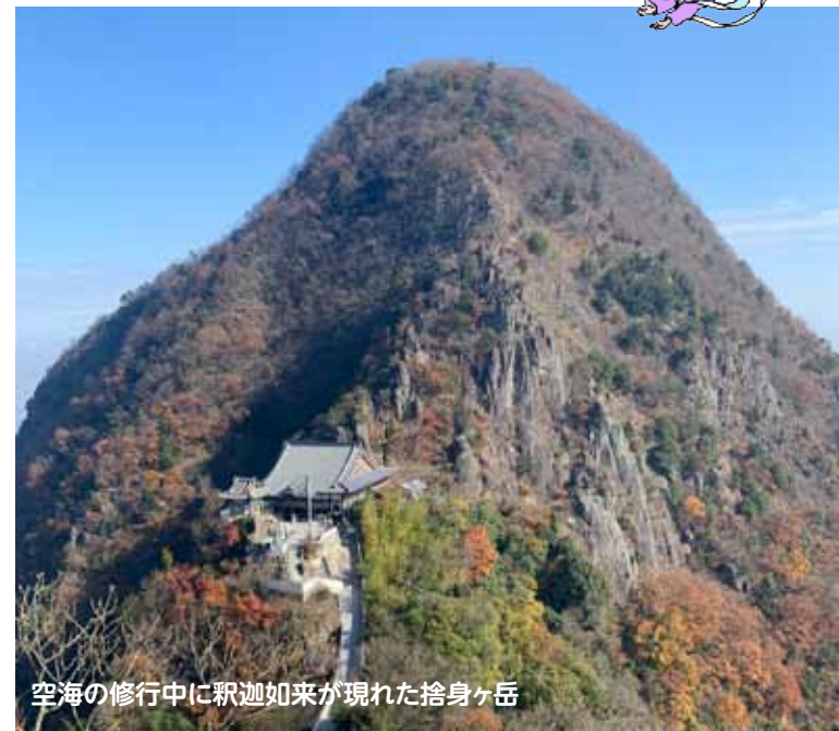
空海の修行中に釈迦如来が現れた捨身ヶ岳