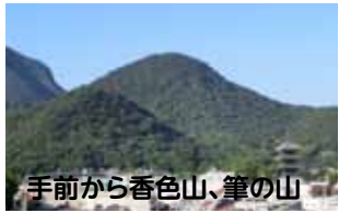
手前から香色山、筆の山

山容が筆の穂先似ていることから名づけられました(下写真)。山腹には石鏡教の行場の鎖場があります。山頂には宝生如来が祀られています。