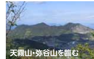
天霧山・弥谷山を臨む