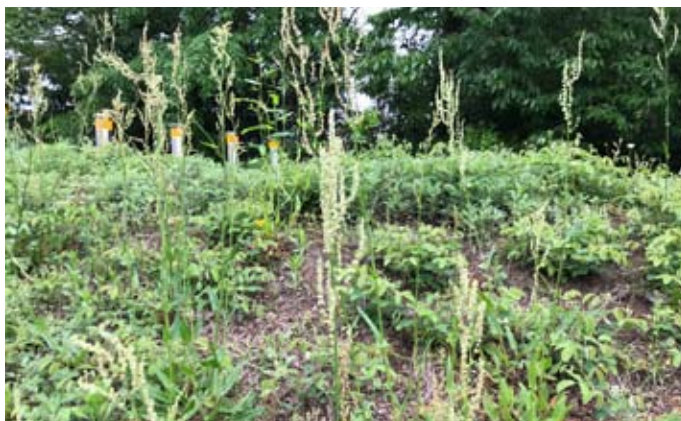
群生するスイバ（土器川生物公園）。

スイバは、動物のようにメスとオスが別々にあります。なぜでしょうか。野外観察から考えます。（この問題は未解決です。）